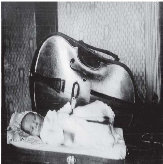
Mstislav Rostropovitch, nouveau-né en 1927. L'étui à violoncelle lui sert de berceau.