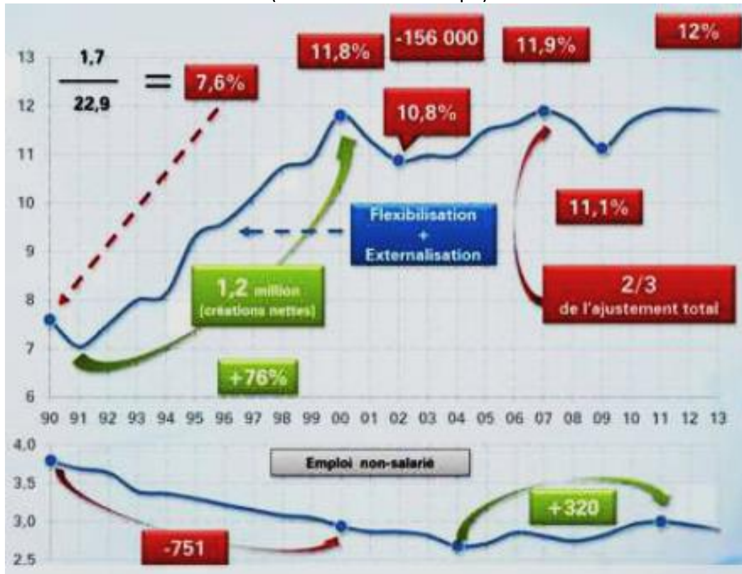
Le graphique, 20 ans d'emploi précaire