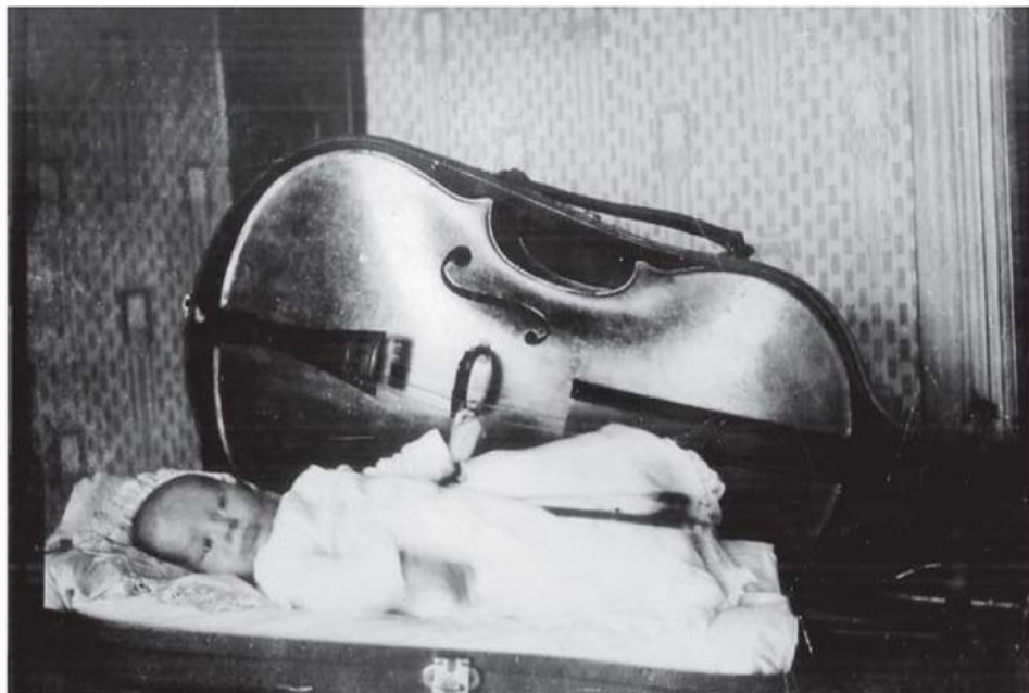
Mstislav Rostropovitch, nouveau-né en 1927. L'étui à violoncelle lui sert de berceau.

Q.1. (Photo 1) A En quoi les éléments biographiques de ce nouveau-né (en particulier sur son père...) conduisent-elles à réfléchir sur les dispositions (savoirs être et savoirs faire...) et les goûts ? D'où peuvent-ils venir ? Comment sont-elles acquises ?